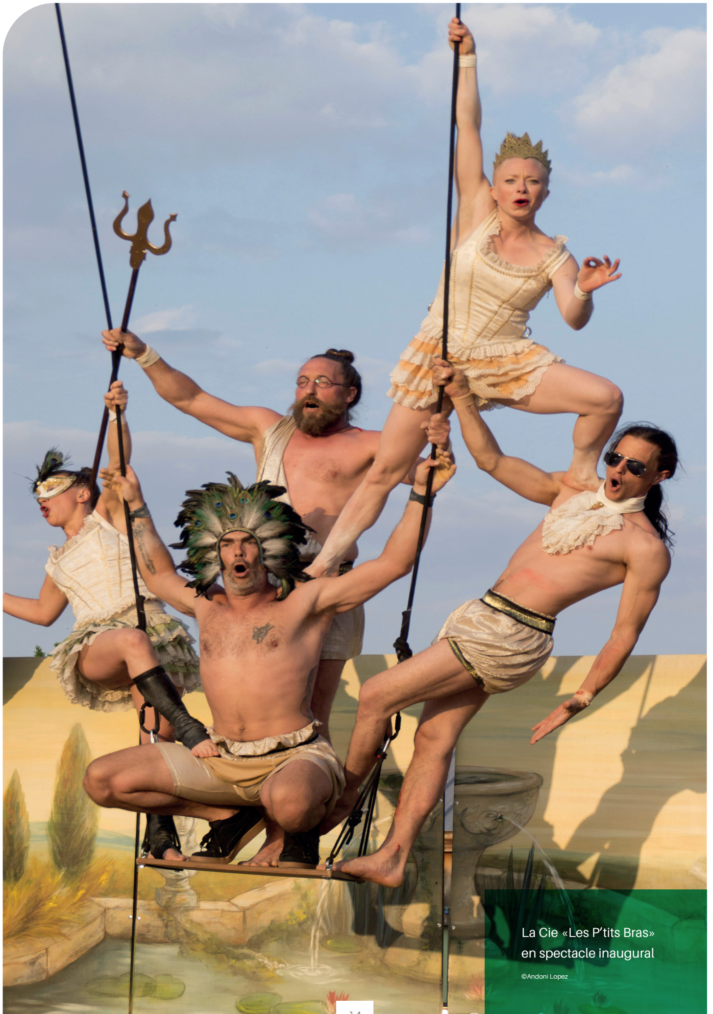
La Cie «Les P'tits Bras» en spectacle inaugural