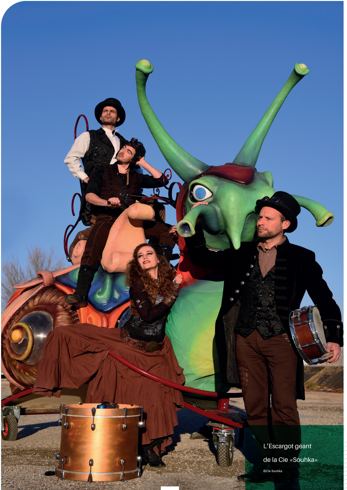
L'Escargot géant de la Cie «Souhka»