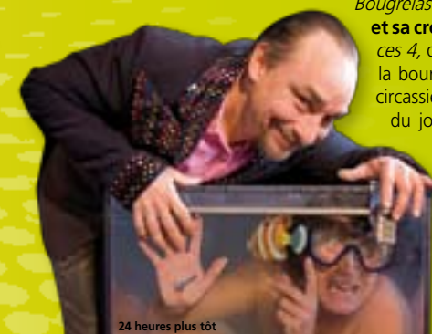
24 heures plus tôt