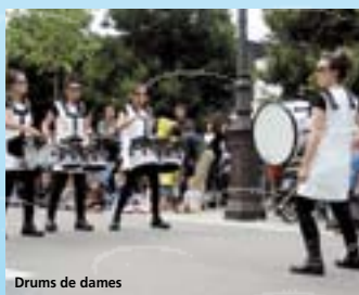
Drums de dames