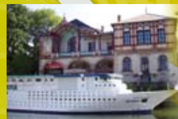
Fête de l'eau et de la rivière →