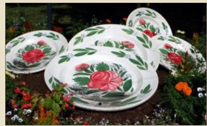
En hommage à l'art culinaire, des assiettes, des bols à bouillon et une soupière, décorent le casino des Faïenceries.

Quant aux touristes de passage, par exemple les plaisan-