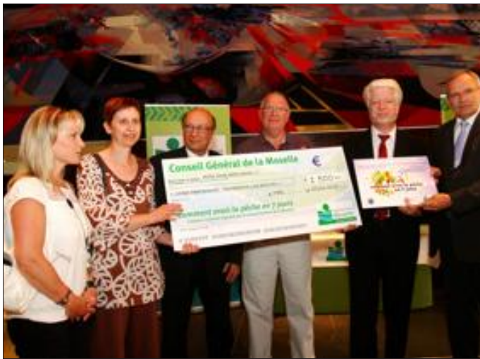
Les lauréats ont été récompensés à Metz.

Dans le cadre du comité d'éducation à la santé et à la citoyenneté, deux concours culinaires ont été organisés au sein des collèges mosellans. Le premier s'intitule Les toques 2012 de la restauration scolaire ; le second Comment avoir la pêche en 7 jours. L'établissement de Rohrbach-lès-Bitche décroche la deuxième place pour les toques de la restauration scolaire et le premier prix dans le cadre de Comment avoir la pêche en 7 jours. Une dotation de 2 500 € lui a été allouée.