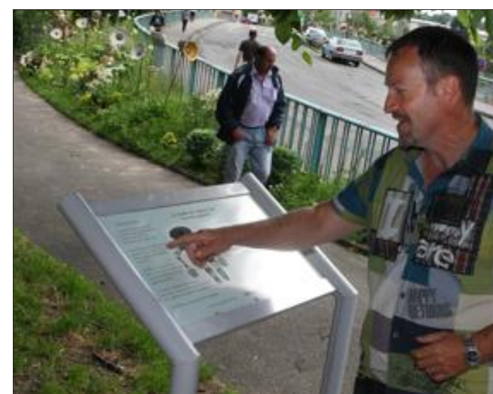
A chaque espace, le mot du jardinier commente la visite, en français et en platt.